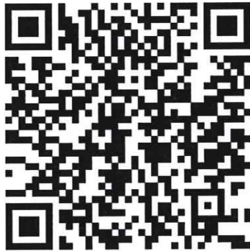
比賽報名專址 QR Code